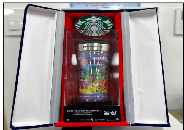
코리아 스타벅스 / 황인성 작