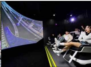
미디어아트 영상관 4D 체험관