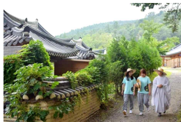
템플스테이 체험 지원