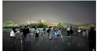
‘생생 국가유산’ 천체관측