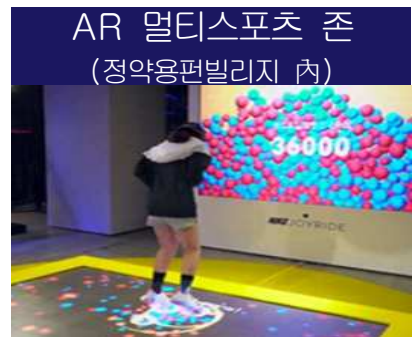
AR 멀티스포츠 존 (정약용펀빌리지 내)