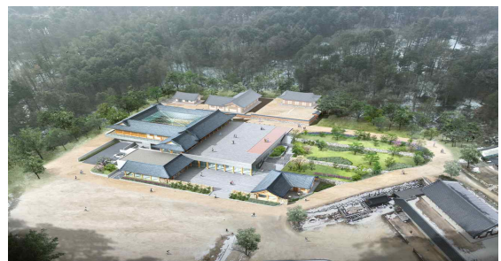
봉선사 명상 체험센터 건립 (조감도)