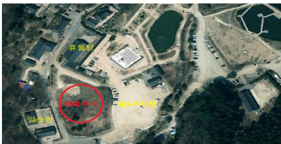
봉선사 명상 체험센터 건립 (위치도)