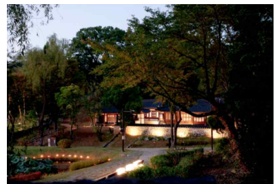
남양주 궁집 야간 운영