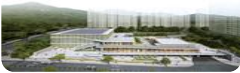
시설: 수영장, 문화센터, 다목적체육관 등 / 총 사업비: 450억원